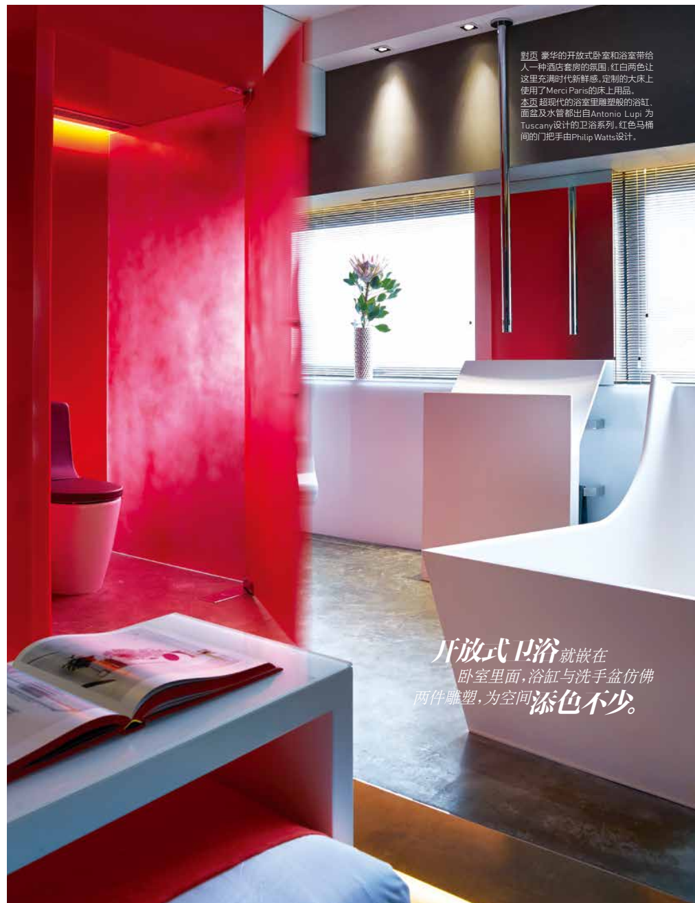
翻页 豪华的开放式卧室和浴室带给人一种酒店客房的氛围;红白两色让这里充满时代新鲜感。定制的大床上使用了Merci Paris的床上用品。本页 超现代的浴室里雕塑般的浴缸、面盆及水管都出自Antonio Lupi 为Tuscany设计的卫浴系列。红色马桶间的门把手由Philip Watts设计。